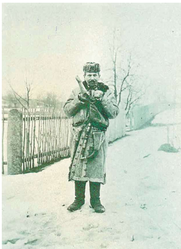
Obr. 5 Černý, Vojtěch. Muš v kožichu s tulipány a čepici vydrovce s dudami leskovického dudáka . Služátky, 1914, pozitív, 85 × 115 mm. MVP, inv. č. F957-6885