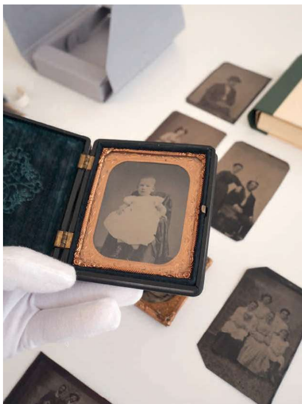
Referenčná zbierka KR a KFaNM VŠVU