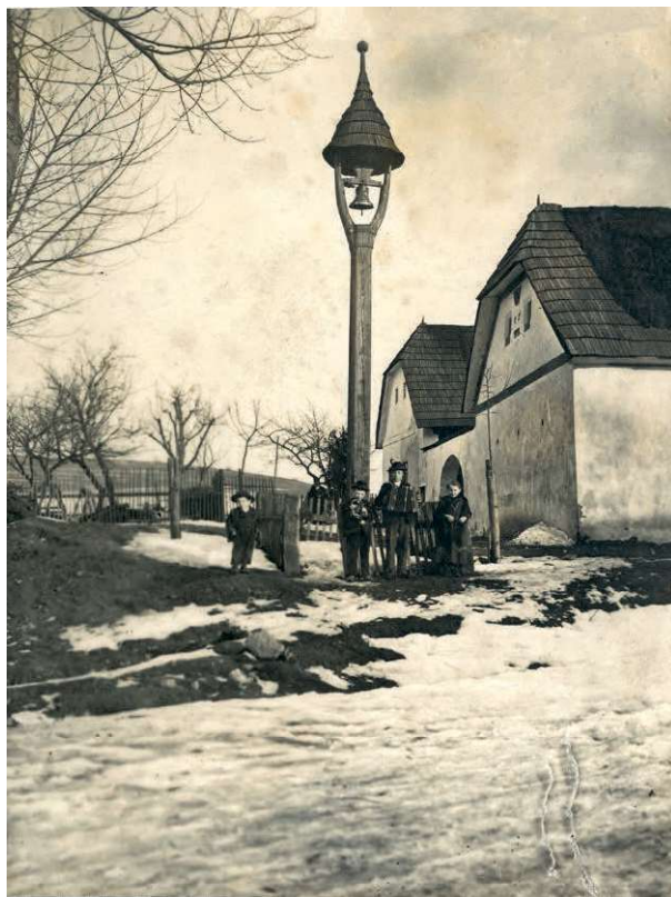
Obr. 2 Zvonička „dvoják“ před statkem čp. 6. Sedliště, 1914, pozitiv, 85 × 115 mm. MVP, inv. č. F892-8885-15

Samotné dotazníky se staly součástí fondu Okresní školní výbor Pelhřimov Okresního archivu Pelhřimov (nyní Moravský zemský archiv v Brně – Státní okresní archiv Pelhřimov) a byly dlouho považovány za ztracené. 6 Informace z nich byly v období první republiky vytěžovány jen minimálně při řešení dílčích tematických úkolů publikovaných v regionálních sbornících Zálesí a Vlastivědný sborník českého jihovýchodu . Komplexního zhodnocení se dočkaly až v novém tisíciletí. V roce 2006 vyšel ve Vlastivědném sborníku Pelhřimovska