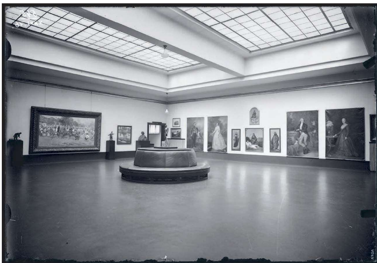
Obr. 8 Pohled do stálé expozice obrazárny. Brno, 1930–1935(?), negativ, 130 × 180 mm. Archiv MG, FOMZM I, sbírka negativů, inv. č. N545