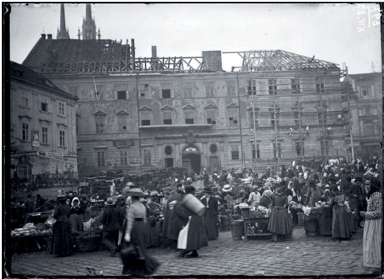
Obr. 7 Dětichštejnský palác za přestavby. Brno, 1927(?), negativ, 90 × 120 mm. Archiv MG, FOMZM I, sbírka fotografií, inv. č. N697