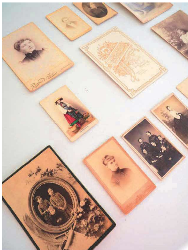
Referenčná zbierka KR a KFaNM VŠVU (KF a NM – Katedra fotografie a nové médiá)

Mojou víziou je, že sa s programom zameraným na reštaurovanie fotografie dostaneme do povedomia v globálnom rámci Európy a sveta, aby sme si nezískali uznanie len ako dobrí žiaci a nasledovatelia, ale aby sme sa im vedeli vyrovnat' kvalitou vzdelania aj vzdelávania a úrovňou tvorby a tiež, aby sme s programom v oblasti reštaurovania fotografie na KR VŠVU rovnocenne stáli po boku krajín ako Holandsko, Francúzsko, Taliansko, Nemecko, Anglicko či USA. Veľkou výzvou je posunúť sa od historicky vzdialených fotografických procesov a novších analógových fotografických techník až do digitálnej fotografickej súčasnosti.