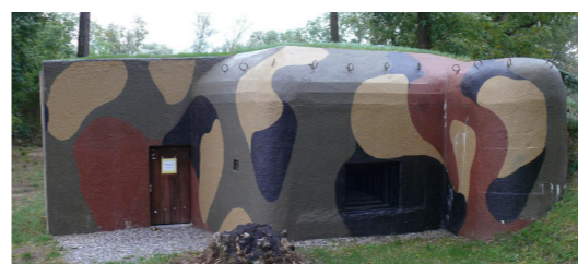
9) Lehký objekt ŘOP / Dyjákovice