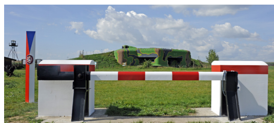
3) Pěchotní srub MJ – S 3 / Šatov