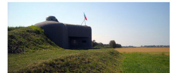
8) Pěchotní srub MJ – S 15 / Dyjákovice