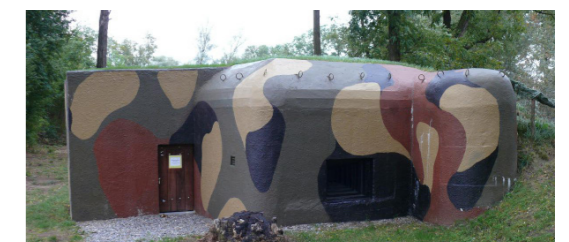
9) Lehký objekt ŘOP / Dyjákovice