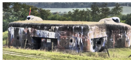
10) Pěchotní srub MJ – S 29 / Mikulov