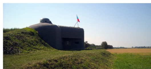
8) Pěchotní srub MJ – S 15 / Dyjákovice