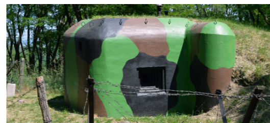
6) MINIMUZEUM / Moravský Krumlov