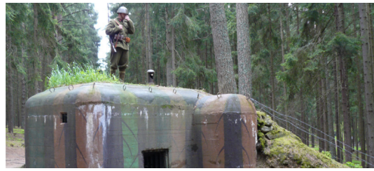
1) Pevnostní areál / Slavonice