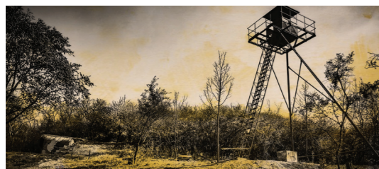
5) Bunkr V úžlabině / Dyje