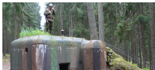
1) Pevnostní areál / Slavonice