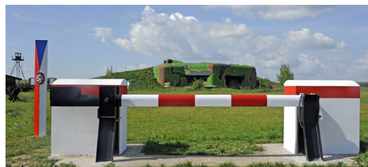
3) Pěchotní srub MJ – S 3 / Šatov