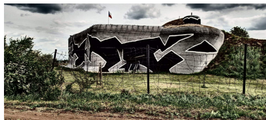
4) Pěchotní srub MJ – S 4 / Chvalovice