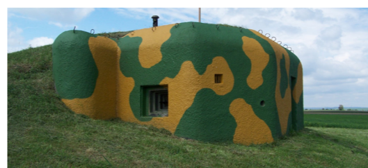
7) Muzeum čs. opevnění / Slup