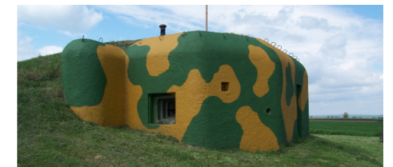
7) Muzeum čs. opevnění / Slup