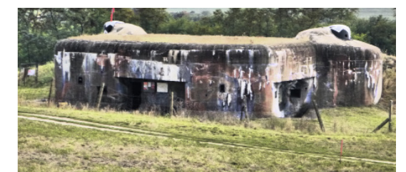
10) Pěchotní srub MJ – S 29 / Mikulov

Společná akce provozovatelů pevnostních muzeí na jižní Moravě / 10 zpřístupněných pevnostních objektů / doprovodný program na mnoha objektech