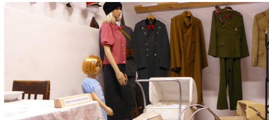
1) Muzeum XX. století / Slavonice