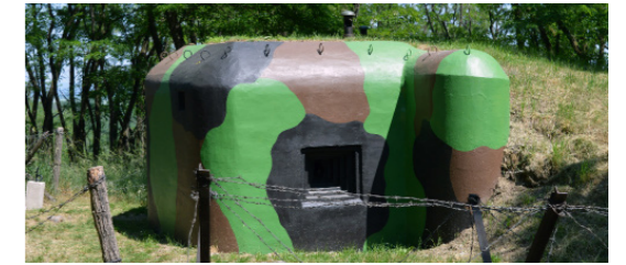
6) Minimuzeum / Moravský Krumlov