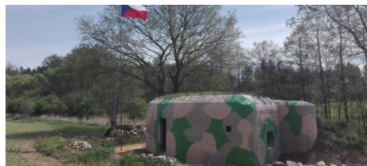
2) Minimuzeum opevnění / Vratěšín