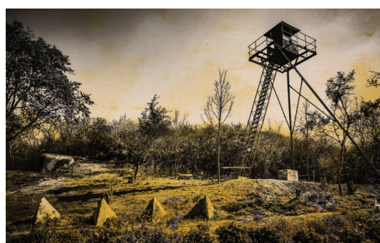
5) Muzeum lehkého opevnění / Dyje