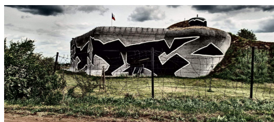
4) Pěchotní srub MJ – S 4 / Chvalovice