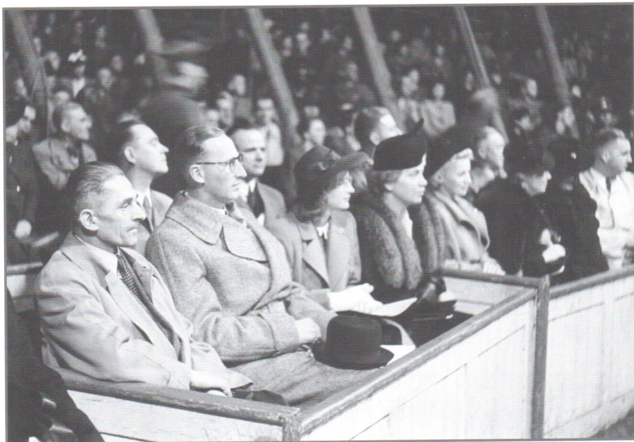
Obr. 1 K. H. Frank, R. Heydrich a R. Gies s manželkami a H. Böhme na představení cirkusu Krone. Praha, 8. říjen 1941, pozitiv, 12,5 × 17,5 cm (inv. č. 1118)

Výsledkem tohoto trendu je, že roste množství digitálních reprodukcí historických snímků a s tím je nutně spojena otázka, jak lze tuto záplavu fotografií vlastně využít a jak ji zpřístupňovat (popisovat), aby vůbec využitelná byla. Těmto tématům jsou věnovány následující řádky. V úvodu nastíníme nejčastější přístupy k využívání fotografií a poté se budeme především věnovat konkrétním praktickým postupům, jakým způsobem lze z obrazových dokumentů odečíst potřebné informace, které poslouží k jejich co nejuplněnějšímu popisu. Tyto postupy budeme ilustrovat na fotografiích z období nacistické okupace obsažených v archivní sbírce Fotoarchiv K. H. Franka, uložené v Národním archivu v Praze. 2)